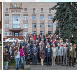
XII 2015 Петрозаводск «Петрография магматических и метаморфических горных пород»