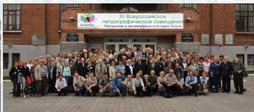
XI 2010 Екатеринбург «Магматизм и метаморфизм в истории Земли»