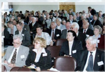
X 2005 Апатиты «Петрография XXI века»